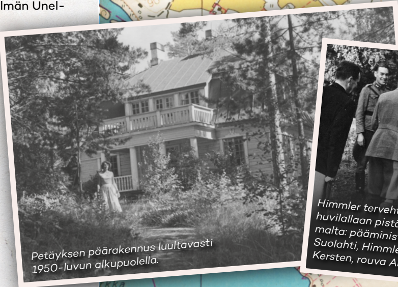
Petäyksen päärakennus luultavasti 1950-luvun alkupuolella.